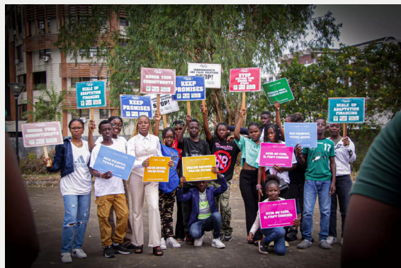
LCOY 2025: Gabonese youth assert their climate leadership

En 2025, le projet international WTFutures a fait émerger plusieurs pistes originales qui découlent d’une intuition centrale : les jeunes nés au XXIe siècle sont des “natifs du climat”, qui ont grandi toute leur vie dans un monde marqué par la perspective, voire la réalité sensible du changement climatique. Cette caractéristique commune ne les rend pas moins divers que toutes les générations précédentes, mais elle teinte profondément leurs choix, leurs aspirations et leur relation aux institutions.